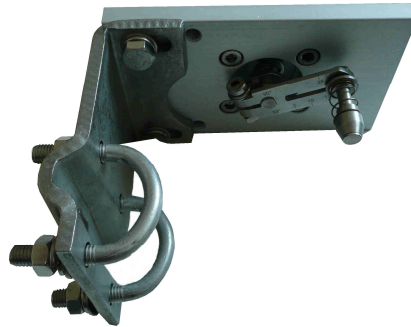
Abb.: Anbau an Guss-, Säulen- und Flachlaternen. Hub: 10 bis 35 und bis 100mm, die gezeigte Edelstahl-Platte gehört nicht zum Anbausatz.